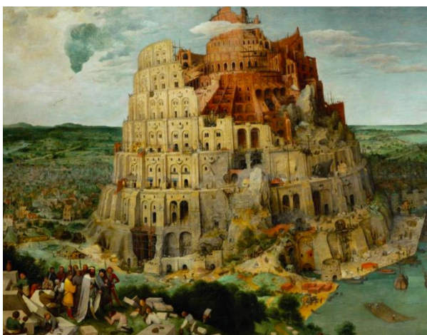
La Tour de Babel, par Pieter Bruegel l'Ancien, vers 1563