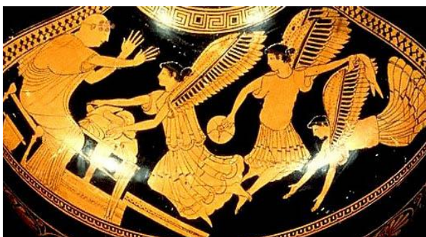
Vase grec antique