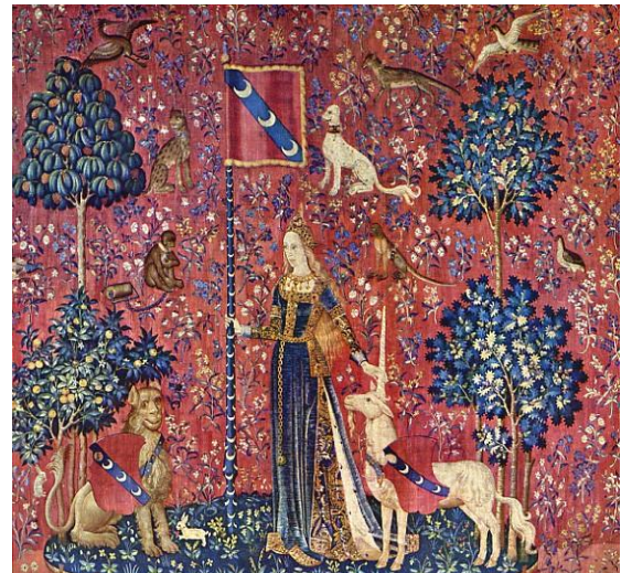
La dame à la licorne, Musée de Cluny, Paris, entre 1484 et 1500

*Les ailes représentent l'ouverture du chakra cœur. Son rayonnement donne cette image d'ailes. On les trouve chez les anges, ainsi que chez le Sphinx des Egyptiens (symbole du courage du cœur).